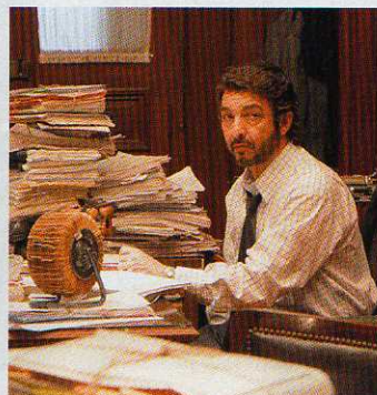
Katseeseen kätketty -elokuva tuli elokuvateattereihin viime viikolla.

5 IHANA PUTIIKKI. Haluaisitko lampunvarjostimen Designers Guildin kankaasta? Entä samanlaisen ekolaukun kuin Tarja Halosella ? Löydät ne Tammisaaren Kompaniet-liikkeestä. TT