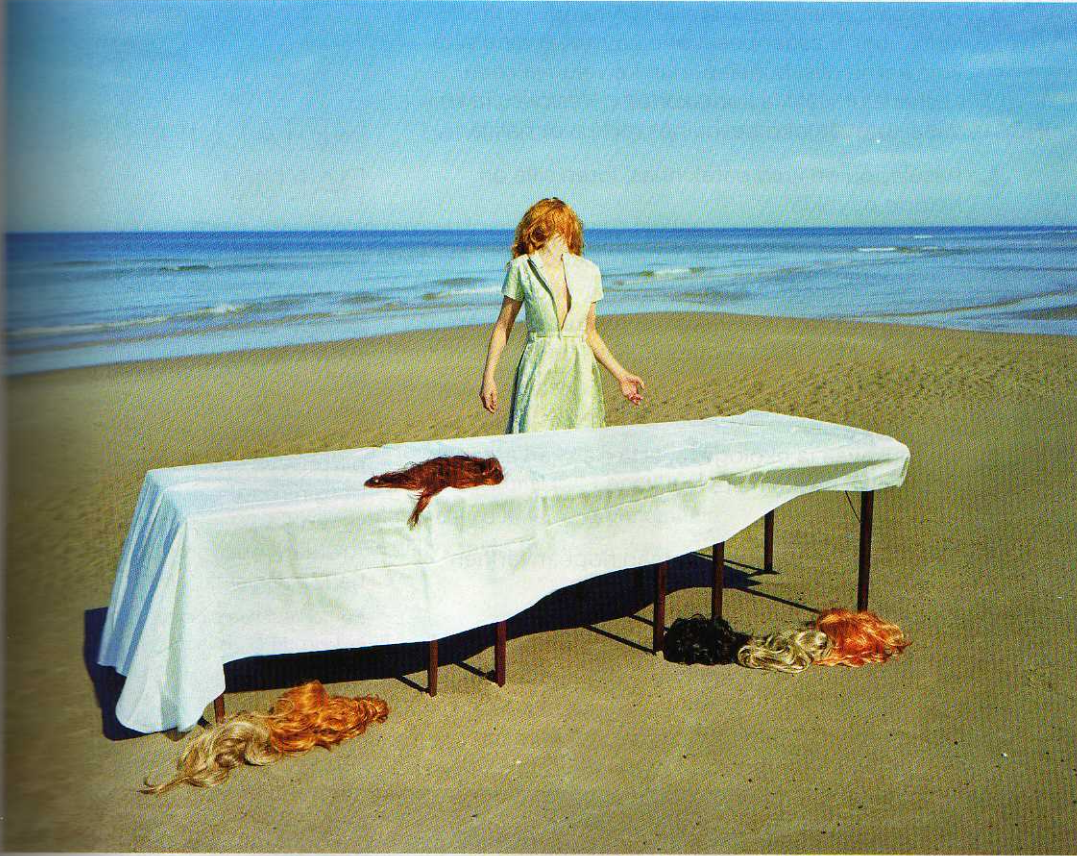
Denise Grünsteinin valokuvat ovat esillä Kiasmassa elokuun alkuun asti.

Toukokuu tarjoaa valokuvia, kuvataidetta, tyylikkään elokuvan ja kiinnostavan kaupan.