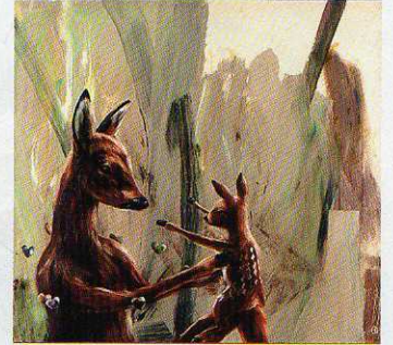
Äiti leikkittää lasta -teos perustuu Albert Edelfeltin maalukseen Kuningatar Blanka.

3 ISÄN KUVIA. Mitä syntyy, kun 1960–70-luvuilla syntyneet kuvanveistäjät pohtivat isän kuvaa? Se on nähtävissä Isä, poika ja Pyhäjärvi -näyttelyssä Taidehallissa Helsingissä. Mukana muun muassa apina, kolmemetrinen mies ja suihkussa laulava pappi. Lisätietoa: www.taidehalli.fi .